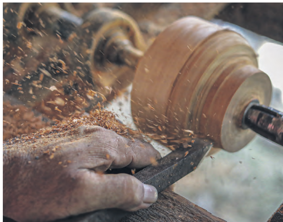
Proses melarik fasa penting bagi menentukan keseimbangan. Setiap lekuk dibuat teliti agar gasing indah dipandang dan tahan diuji di gelanggang