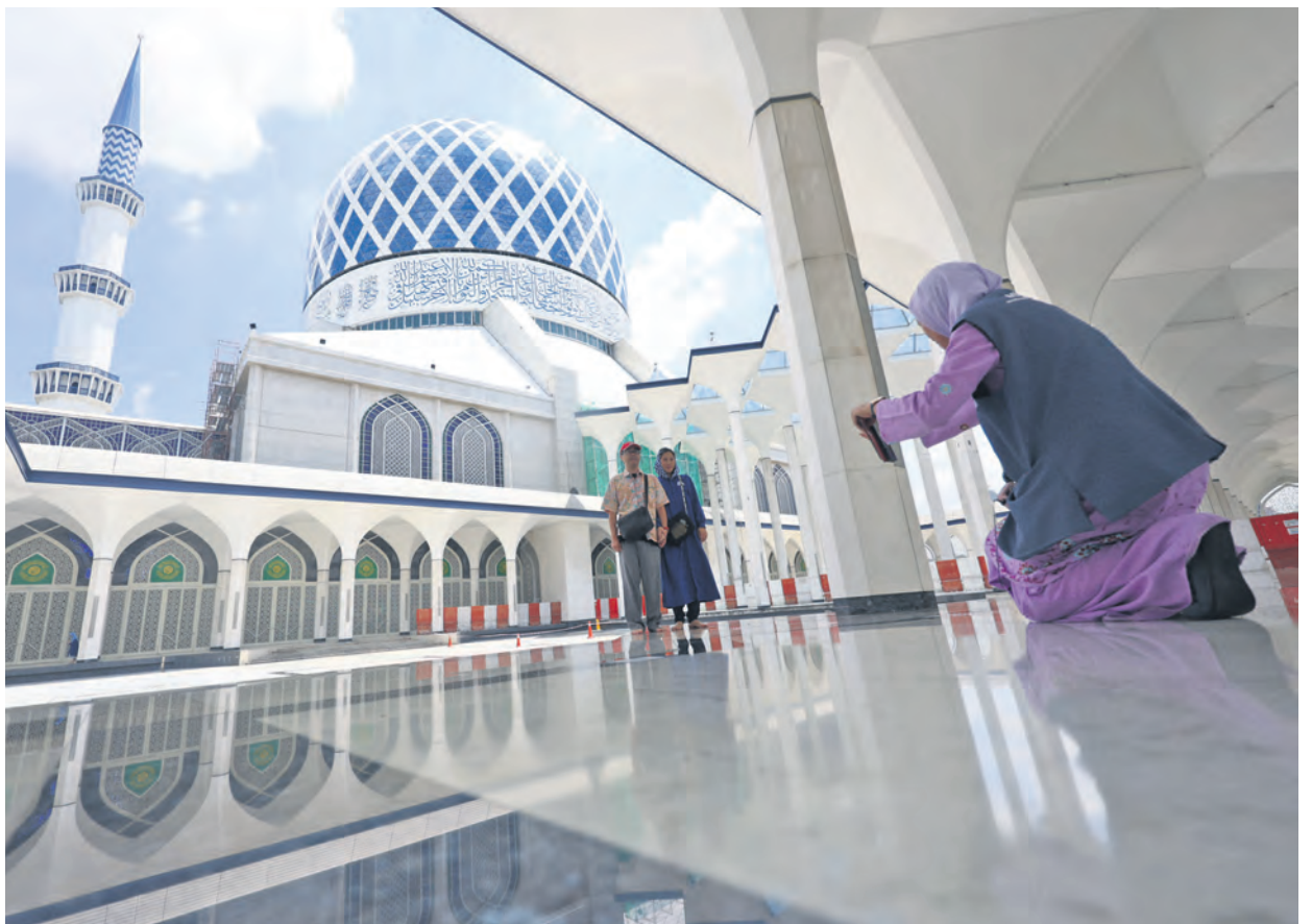
Petugas masjid membantu pelancong Jepun merakam gambar kenangan semasa melawat ke Masjid Sultan Salahuddin Abdul Aziz Shah di Shah Alam pada 12 Ogos 2025.