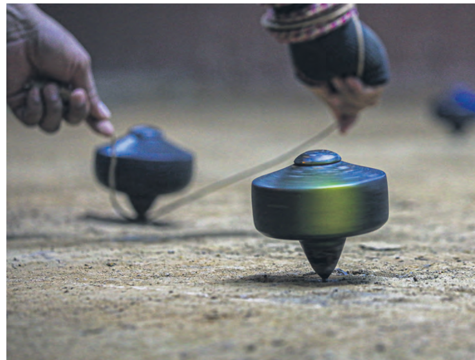
Pemain berlatih teknik hayunan yang tepat bagi pastikan pangkahan mengena dan putaran tahan lebih lama