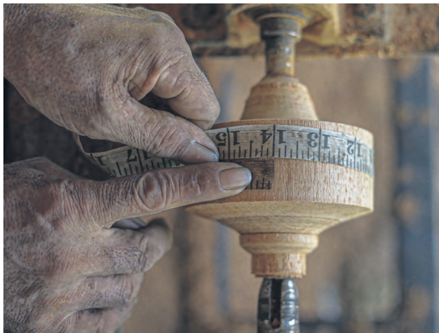
Proses sehingga memperoleh ukuran tepat, selaras piawaian ditetapkan untuk pertandingan gasing pangkah tradisional