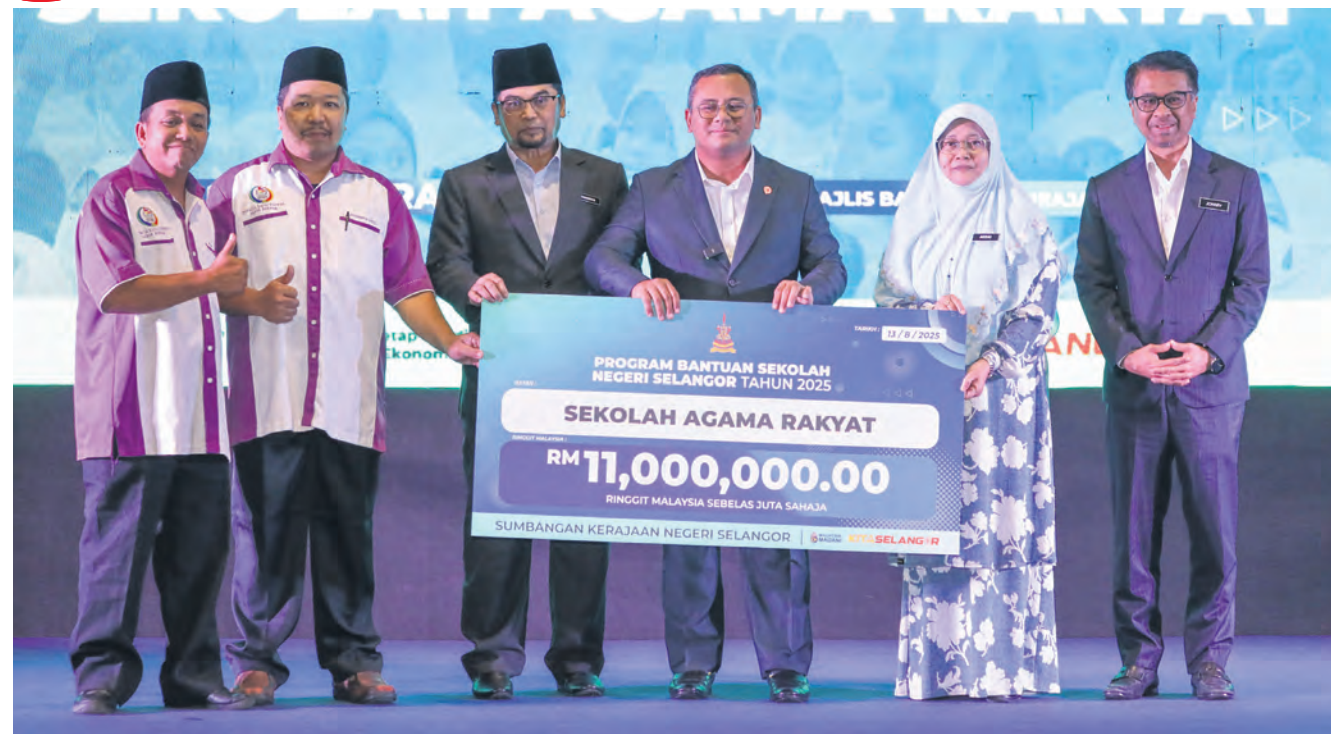
PRIHATIN... Dato' Menteri Besar Dato' Seri Amirudin Shari menyampaikan cek cura kepada wakil institusi pendidikan ketika Majlis Penyerahan Bantuan Sekolah Negeri di Klang pada 13 Ogos. ► BERITA MUKA 2

"Kita juga akan adakan Larian Neon Run pada 10 Oktober, acara malam yang bercahaya untuk menunjukkan semangat dan kemeriahan Shah Alam," katanya selepas melancarkan sambutan Jubli Perak 25 Tahun MBSA dan program Shah Alam Hari Tanpa Kenderaan pada 10 Ogos.