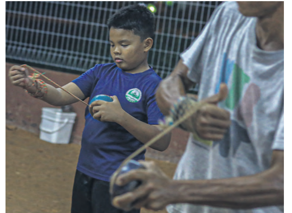
Tali dililit rapi pada gasing agar tidak terlepas saat dihayunkan dan putarannya kekal bertenaga hingga detik terakhir