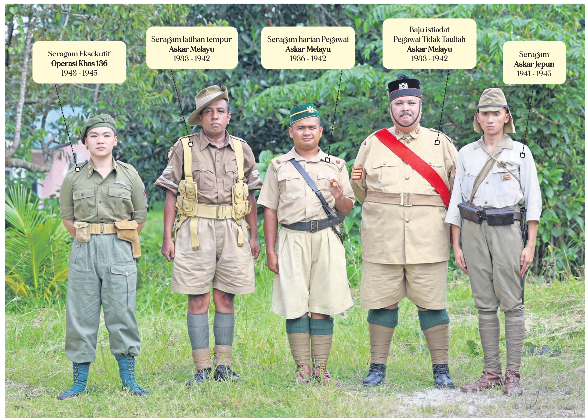
Seragam Eksekutif Operasi Khas 186 1943 - 1945

"Apa yang mereka hanya baca dalam buku teks, kini dapat dilihat secara nyata di depan mata," katanya kepada Media Selangor.